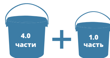
Компонент А (Смола)